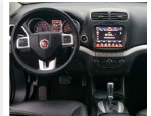
5 INTERNO LATO GUIDA