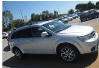
2 FIANCO DESTRO