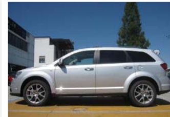
4 FIANCO SINISTRO